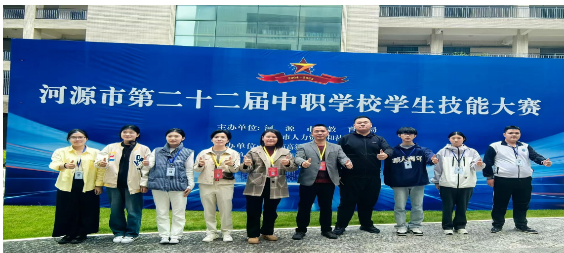
图 8 参加第二十二届中职学校学生技能大赛获得三等奖

在抓好高考文化科的同时，我校坚持落实立德树人根本任务，坚持理论与实践相结合的办学理念，注重学生的职业技术技能培养和体质体能提升，锐意改革创新，不断提升办学质量。本年度，参加国家学生体质健康标准测试人数 196 人，学生体质测评合格率为 96.50%，相比 2024 年提升 1.4 个百分点。在河源市中职学生技能大赛中，我校共派出 2 支队伍参与角逐。分别是个人赛机械类 CAD 和团体赛短视频制作，经过激烈比拼，我校参赛团队凭借扎实的专业功底、精湛的实操技能和顽强拼搏精神，斩获亮眼佳绩，在目前学生人数少、生源素质参差不齐、培训基础差的状况下，从众多参赛队伍中脱颖而出，参赛的两个项目均荣获三等奖。