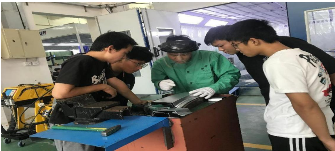
图 14 汽修专业学生在实训实操，学习汽车维修等方面技能

学校与龙门大观园温泉旅游度假区、深圳必优卡汽车服务有限公司、连平县教育示范幼儿园建立校企、校校合作关系，共同开展人才培养、技术研发等活动，进一步提升学生实习实训水平，人员对学生进行汽车维修实用技术、礼仪、服务、文员等方面的技能培训，有效提升了学生的技能水平。