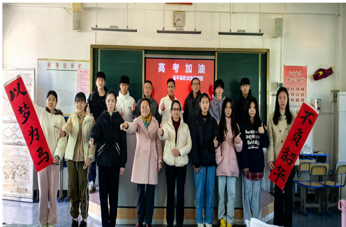
图 7 连平县职业技术学校 2022 级电子商务高考动员

连平县职业技术学校全体师生不忘初心、砥砺奋进，在生源基础偏差、没有高考经验的情况下，克服重重困难，以科学有效的方法，拼搏实干的精神，积极探索“3+证书”高考备考新模式，推行理论与实践相结合的办学理念，重实践，谱新篇。为充分激发学生潜能，舒缓紧张的学习压力，点燃学生的学习激情，营造积极向上的学习氛围，连平职校在高考前隆重举行了以“高考冲刺，为梦而战”为主题的高考誓师动员会。2025 年连平职校实现高考取得可喜成绩：22 电子商务班参加中职高考共 17 人，其中参加“3+证书”高考 13 人，上线率 100%，4 人参加单招考试，上线率 100%。