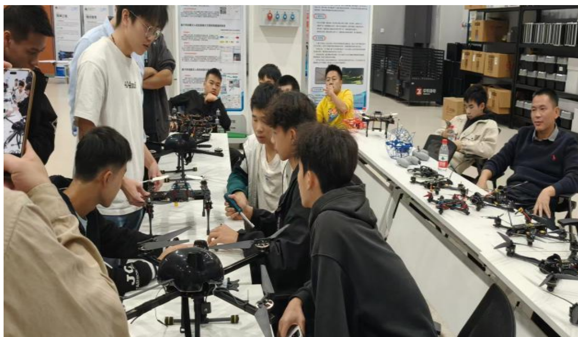
图4 2025年11月11日连平职校组织学生到深圳技术大学开展社会实践活动