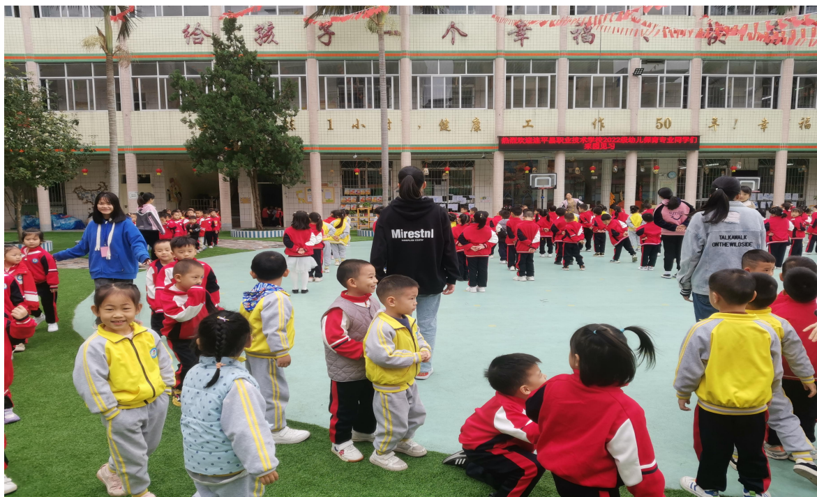
图3 连平县职业技术学校组织幼儿保育专业到连平县教育示范园开展见习活动