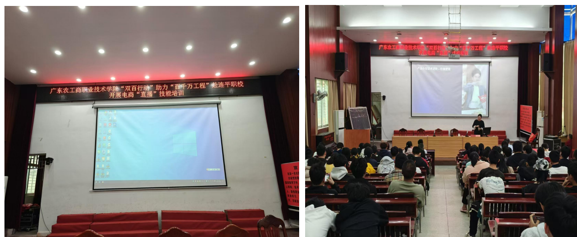
图 18 广东农工商职业技术学院技术骨干对学生进行电商“直播”技术技能培训

为进一步推动高质量开展“百校联百县”助力“百千万工程”工作，落实好 2025 年广东农工商职业技术学院、深圳技术大学与连平职校双方“双百行动”工作任务，10 月 28 日——29 日，广东农工商职业技术学院教师发展中心副主任、教授许统德，广东农工商职业技术学院驻连平县服务队副队长栾飞一行，到我校开展百校联百县技术技能培训和专家送教活动。分别对师生开展了电商“直播”技术和“车身修复”技术技能培训，全校师生全程参与技术培训，培训电商“直播”技术 392 人次，培训“汽车修复技术”120 人次，培训教师 108 人次，共 620 人次。通过专家授课和学生现场演示，使我校师生大开眼界，提升了学生专业技术技能，为推动两校互联互通和连平职校高质量发展作出积极贡献。2025 年，全县培训学生技能人才累计 1000 人次。