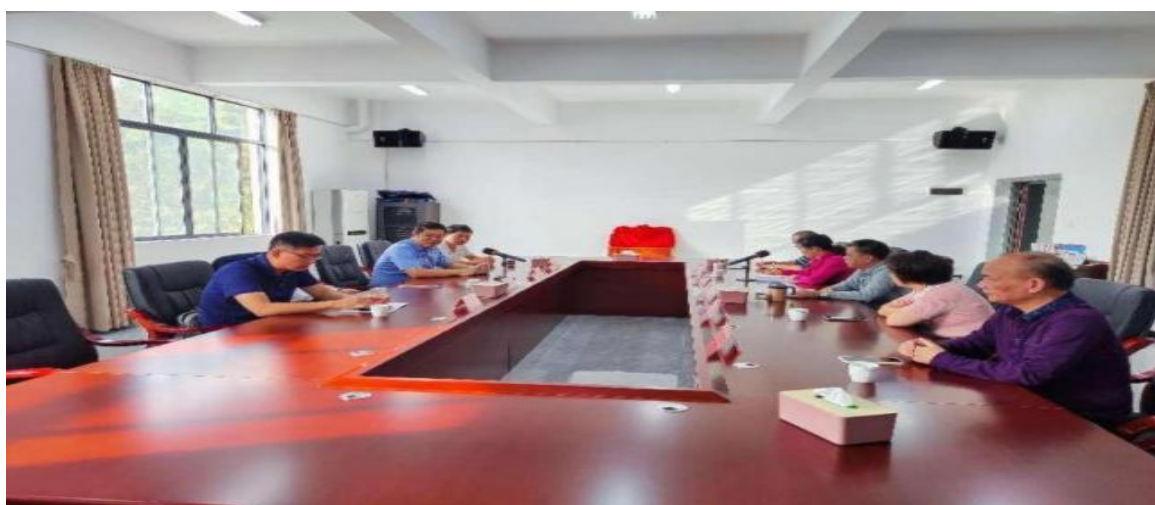
图 16 校领导与深圳技术大学、广东农工商职业技术学院商讨建立实训基地事宜

为推动我校实训技能水平提升，深圳技术大学、广东农工商职业技术学院助力“百千万工程”百校联百县“双百行动”的领导5月中旬到我校开展合作交流“实训基地”挂牌仪式，通过双方建立“实训基地”，实现互联互通、优势互补，努力提升职校师生职业技术技能水平，进一步开阔师生视野，增长学生技能才干，标志着连平职校学生的实训就业工作迈入新的台阶，为提升连平职校办学水平，赋能连平职校高质量发展作出积极贡献。