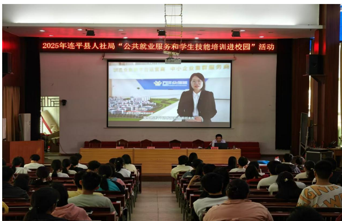
图 13 邀请县社保局开展就业服务和学生技能培训，推动学校与社区和谐共建

为推动连平职业技术学校学生技能提升和拓宽学生就业渠道创造了条件，打下了基础。今年 5 月，邀请连平县社保局专业人士就学生的职业技能培训进行了现场指导，讲授有关公共服务方面的职业技能培训等方面的内容，尤其是对计算机专业、服务专业等方面的职业技能进行了深入浅出的讲解，在当前的就业环境下，对提升学生的技能水平起到了良好的推动作用。通过培训，学生受益匪浅、收获多多，培训人次 366 人次。连平职校将以此次开展技能培训进校园活动为契机，加大对学生技术技能培训力度，积极更新教育理念，推动连平职业教育上新的台阶。