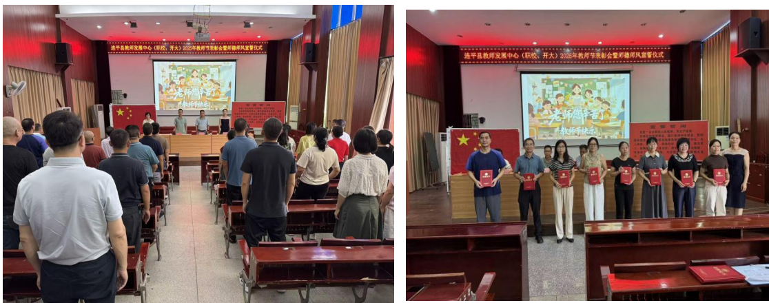
图 11 连平职校举行 2025 年教师节表彰大会