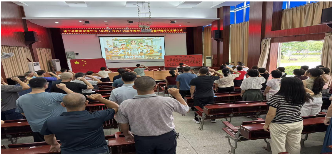
图 10 连平职校全体教职工进行庄严宣誓，为教育事业奉献终身决心

在 2025 年教师节到来之际，为加强教师队伍建设，学校组织全体教师庄严宣誓，全体教师纷纷表示要守住底线，教师育人、为人师表，用自己的承诺和行动表达自己忠于国家忠于党，为教育事业奉献终身的决心，全体教师纷纷表示要立德树人，为推动职校高质量发展作出积极贡献。