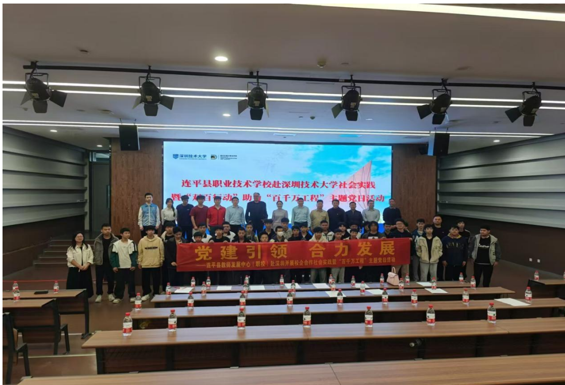
图 2 党总支组织党员到深圳技术大学开展主题党日活动、开展社会实践活动

组织党员认真学习贯彻新修订《中国共产党问责条例》，先后开展主题党日活动 2 次，通过参观廉政教育基地、现场参观深圳技术大学党建工作、重温入党誓词等方式，让党员干部思想得到升华，精神受到洗礼，引导党员干部树立“爱岗敬业勤为先，修身立德廉为本”的工作作风，进一步增强了党员的宗旨意识。同时，党总支组织学生到深圳技术大学开展社会实践活动暨“双百行动”助力“百千万工程”主题党日活动。通过党建引领，深化开展实训合作项目事宜，进一步实现“两校”互联互通、优势互补，努力提升连平职校师生职业技术技能水平起到良好的促进作用。