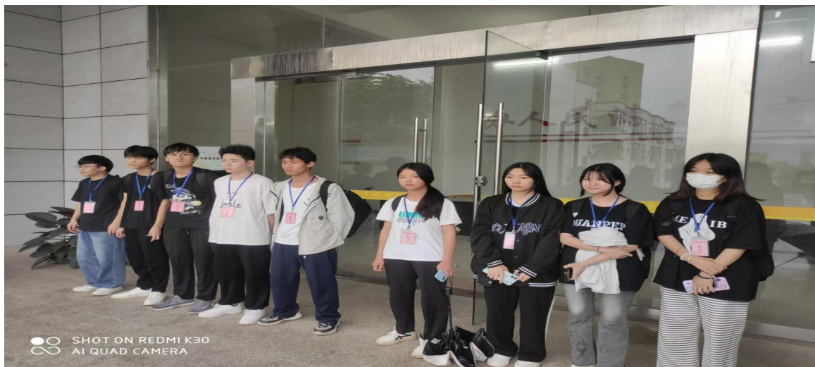
图 15 连平职校组织电子计算机、电子商务专业学生龙门大观园温泉度假村开展实习