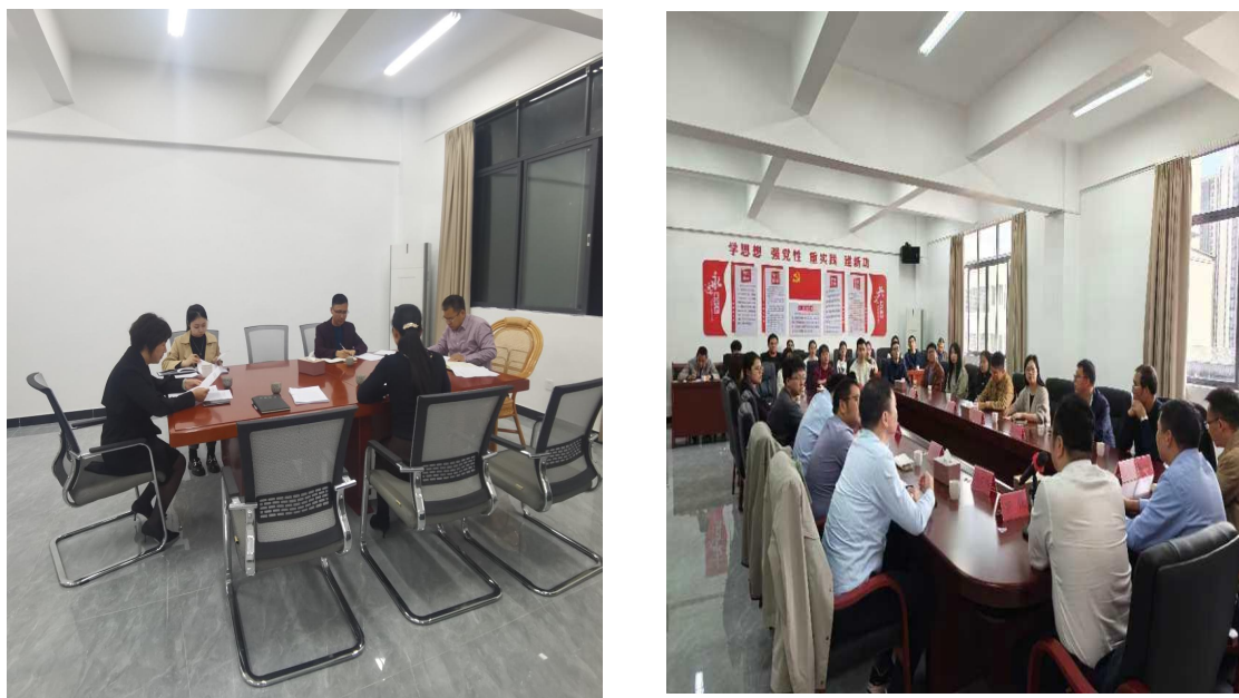
图1 坚持“第一议题”学习制度，每周进行党的理论知识学习，提升党支部战斗力和凝聚力

学校以党建为引领，今年以来，在县委教育工委正确领导下，连平职校党总支坚持以习近平新时代中国特色社会主义思想为指导，认真贯彻落实党的二十届四中全会精神，扎实开展中央八项规定主题教育，以党的政治建设为统领，强化党建工作引领示范，不断加大管党治党力度，抓好班子建设，充分利用“第一议题”制度，党总支会议、“三会一课”学习会、个人自学等方式，深入学习主题教育的有关书目，党风廉政建设不断向好，为连平职校人才培养提供有力的组织保障。