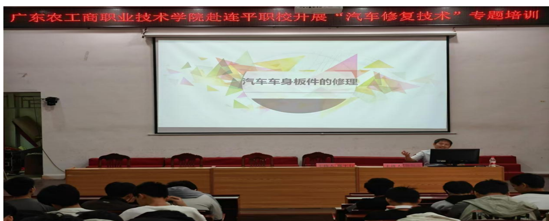
图 5 广东农工商职业技术学院技术骨干到我校开展车身修复技术培训

为进一步推动高质量开展“百校联百县”助力“百千万工程”工作，落实好 2025 年广东农工商职业技术学院、深圳技术大学与连平职校双方“双百行动”工作任务，10 月 28 日——29 日，广东农工商职业技术学院到我校开展百校联百县技术技能培训和专家送教活动。分别对师生开展了电商“直播”技术和“车身修复”技术技能培训，全校师生全程参与技术培训，培训电商“直播”技术 392 人次，培训“汽车修复技术”120 人次，培训教师 108 人次，共 620 人次。通过专家授课和学生现场演示，使我校师生大开眼界，提升了学生专业技术技能，为推动两校互联互通和连平职校高质量发展作出积极贡献。