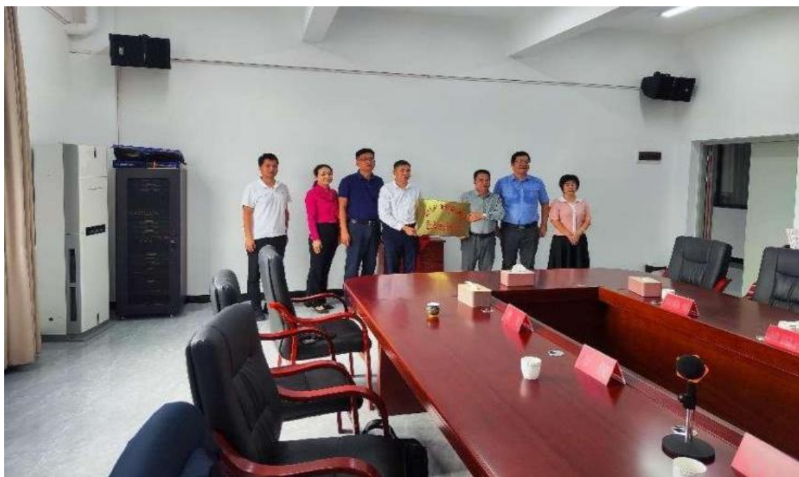
图 17 深圳技术大学、广东农工商职业技术学院到我校共建实训基地

2025 年 5 月，深圳技术大学、广东农工商职业技术学院到连平职校开展合作交流，并举办了实训基地挂牌仪式。以广东省“百校联百县”行动为契机，通过携手共建实训基地，三方实现互联互通、优势互补，努力提升连平职校师生职业技术技能水平，进一步开阔师生视野，增长教师、学生的技能才干。此次实训基地挂牌标志着连平职校产教融合内容和模式得到拓展、学生的实训就业工作迈入新的台阶，为提升连平职校办学水平、赋能连平职校高质量发展作出了积极贡献。