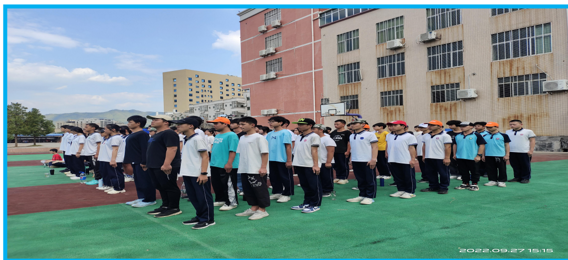
图 9 连平职校学生参加体能测试和军训