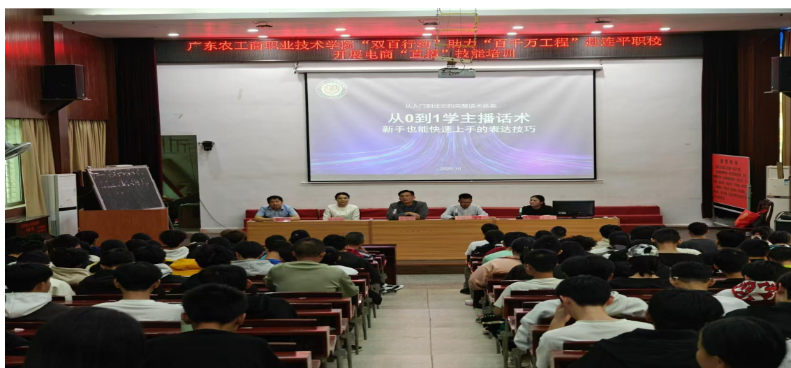
图 6 广东农工商职业技术学院技术骨干到我校开展电商“直播”技术培训